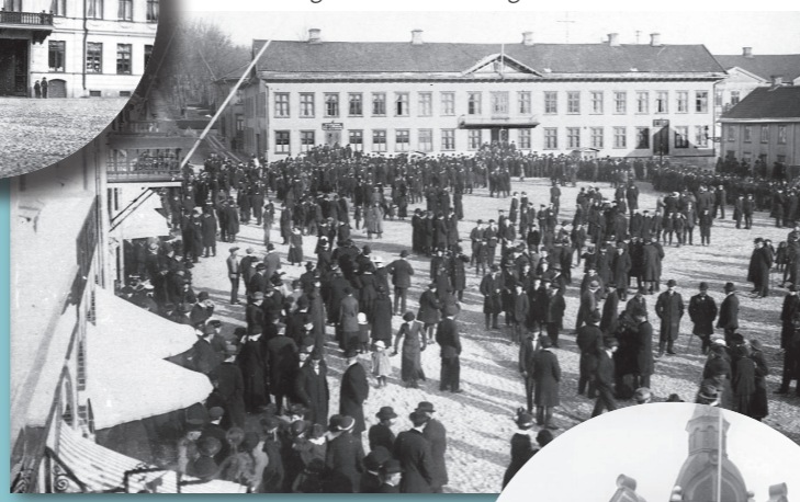
Stora torget med Weramagasinet.

1746 besökte Linné Falköping under sin Västgötareisa. Han imponerades av att en så pass liten stad hade ett så stort torg, 400 steg på längden och 200 på bredden. Då stod stadens rådhus mitt på torget, som inramades av en låg träbebyggelse. I slutet av 1700-talet byggdes ett nytt rådhus i sten längs västra änden av torget (nu rött tegelhus från 1960-talet). Mitt på torget står sedan 1931 en fontän som avbildar kärlekens gudinna Venus, lokalt kallad Malta Johanna. Hon flirtar med guden Mercurius, handelsbeskyddare, som smyckar det s.k. Hallénska huset från 1880-talet på torgets norra sida. Längs torgets östra sida (nu ljusst tegelhus från 60-talet) låg en gång Falköpings största trähus, det s.k. Weramagasinet. Huset brann ner lucianatten 1963. Längs södra sidan ligger 1800-talets trähus kvar.