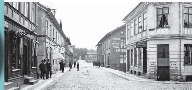
Storgatan upp mot Stora torget.

Under slutet av 1800-talet började affärerna flytta in på Storgatan. Förr fortsatte Storgatan ner till det s.k. Ellet, som låg vid nuvarande Bangatan. Där fanns flera källor och där vattnade man sin boskap och sköljde sin tvätt. Här låg Falköpings första badhus, bryggeri Victoria och garverier. Storgatan förändrades särskilt under rivningsåren 1960–1970. Innan dess kantades gatan av hus från 1800- och början av 1900-talet. Några äldre byggnader finns kvar. I korsningen Storgatan-S:t Olofsgatan ligger t.ex. Kilanderska huset (1902) och Ljungqvistska huset (1903).