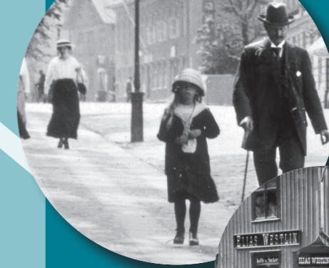
Promenad på Ströget, Sankt Olofsgatan